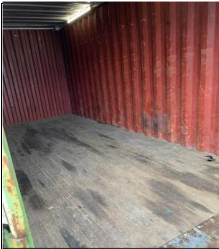
Container 1 (ingen papkasser)